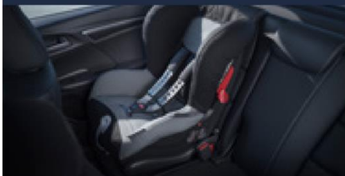
Cadeira infantil Duo Plus (com sistema de fixação ISOFIX)