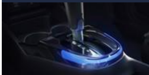
Iluminação do console