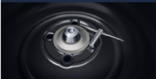
Trava antifurto do estepe