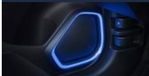
Moldura de iluminação do alto falante

O veículo também traz a combinação perfeita entre o conforto e a tecnologia para garantir a melhor experiência ao dirigir. Moldura de alto falante, soleira, console e interior podem ser iluminados de maneira única, além de contar com pedaleiras esportivas para deixar seu Honda FIT mais esportivo.