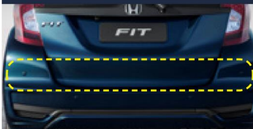
Sensor de estacionamento traseiro