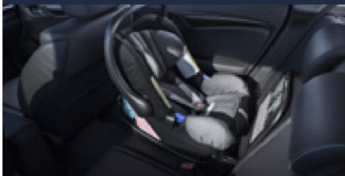
Cadeira bebê Baby Safe Plus II (com sistema de fixação ISOFIX)

O novo Honda FIT possui diversas tecnologias que garantem a segurança e o conforto de todos ocupantes, tais como as exclusivas cadeirinhas de bebê baby safe plus & Duo Plus . Também pensando na segurança e proteção de seu veículo, a Honda desenvolveu o Kit de Farol de neblina & Lente em LED , bem como as Porcas e Travas de segurança para as rodas e estepe.