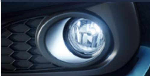
Lente em LED (Farol de Neblina)