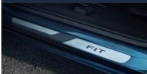
Protetor de Soleira