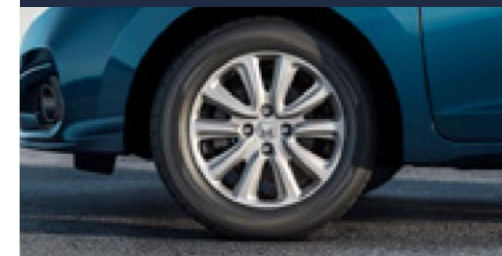
Roda de alumínio