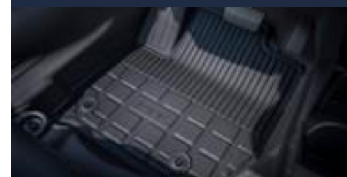
Tapete de borracha