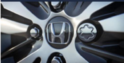
Porca antifurto para rodas