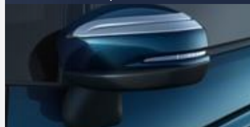
Aplique de espelho retrovisor prata