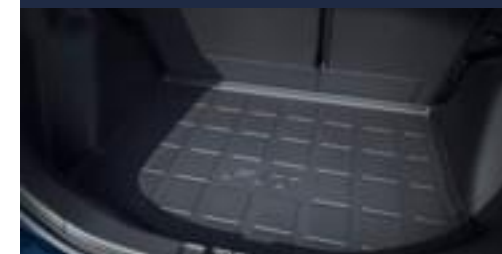
Bandeja de porta mala