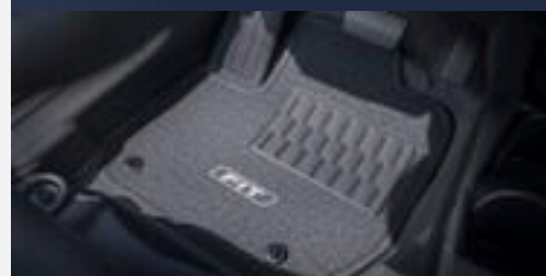
Tapete de carpete standard