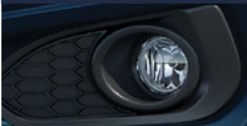
Farol de Neblina, conjunto (com lâmpada halógena)