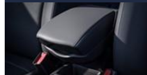
Descanso de braço