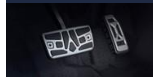
Pedaleira esportiva (CVT)