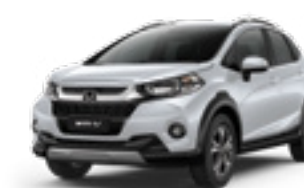
Branco Tafetá Sólido