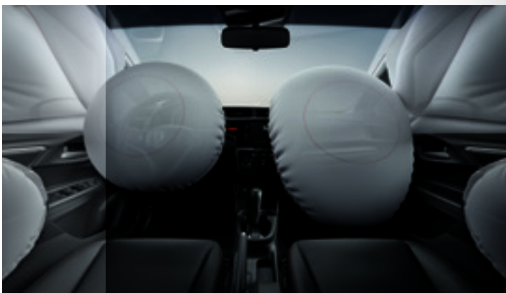
6 Airbags (frontais, laterais e de cortina)

O Sistema Isofix para cadeirinhas infantis garante ainda mais segurança para as crianças. Além disso, o Honda WR-V conta com 2 airbags frontais e 2 laterais para todas as versões e mais 2 airbags de cortina na versão EXL . E para facilitar manobras possui câmera de marcha à ré com 3 ângulos de visões que permite a visualização e detecção de objetos e pessoas.