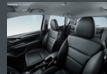
Bancos de couro* com descanso de braço