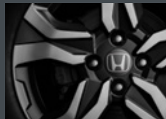
Rodas de liga leve 16"