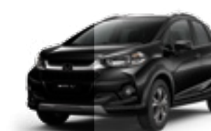
Preto Cristal Perolizado