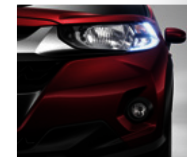
Faróis com luzes de rodagem diurna em LED