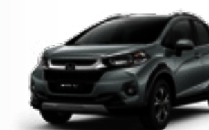
Prata Platinum Metálico