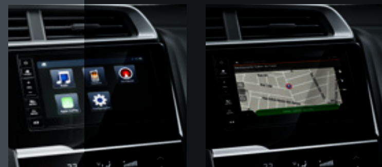
Central multimídia de 7" multi-touchscreen