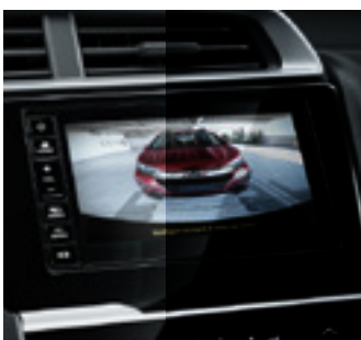
Câmera de marcha a ré