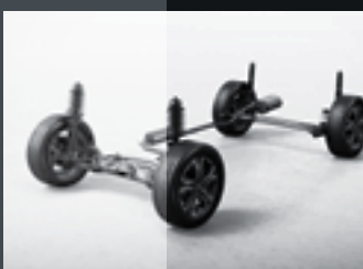
Exclusivo conjunto de suspensões