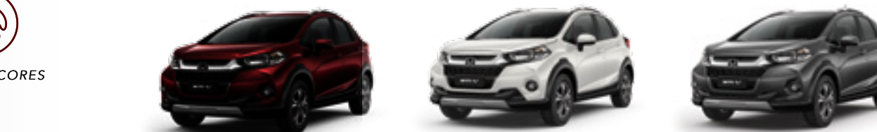
Vermelho Mercúrio Perolizado