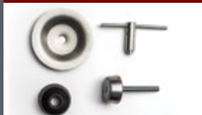
Porca anti furto do estepe

É tanto espaço interno e conforto que não dá vontade de sair de dentro dele.