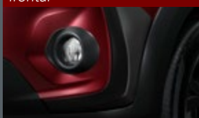
Aplicador de parachoque frontal