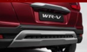
Protetor central parachoque - traseiro