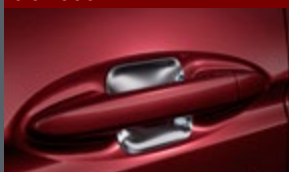
Protetor de maçaneta cromado

Um SUV compacto que atende aos gostos mais exigentes, com design inovador, sem abrir mão da robustez e da presença marcante de um autêntico Honda.