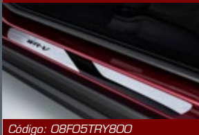
Protetor de soleira