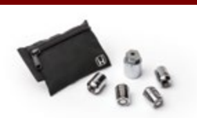
Porca anti furto de rodas