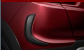
Protetor lateral de parachoque traseiro