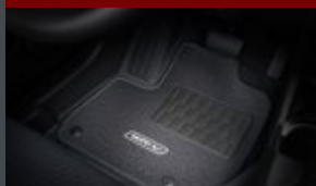
Tapete de carpete standard