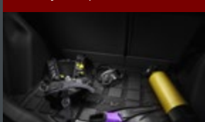
Bandeja de porta malas

Desfrute a todo instante o conforto e a dirigibilidade que só o Honda WR-V pode oferecer a você. Segurança e proteção presentes em todos os detalhes.