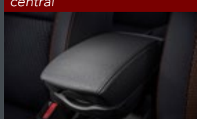
Apoio de braço - console central