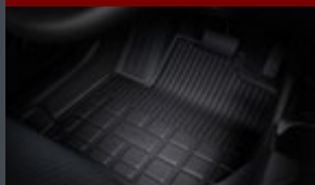
Tapete de borracha