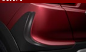
Aplicador de parachoque traseiro