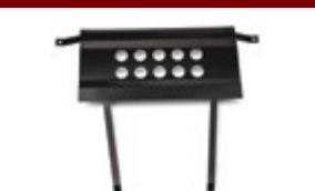
Protetor de cárter