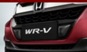
Protetor central parachoque - frontal