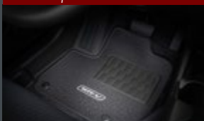
Tapete de carpete luxo - costura prata