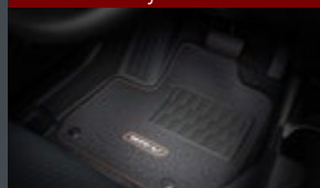
Tapete de carpete luxo - costura laranja