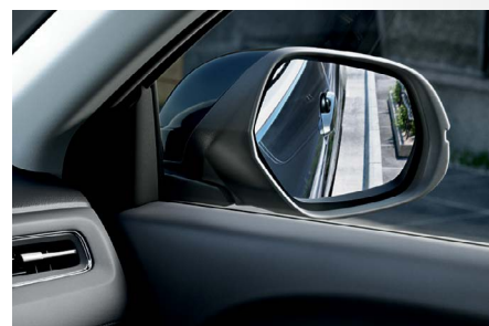
Retrovisores com rebatimento elétrico e função tilt-down.