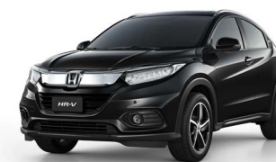
Preto Cristal Perolizado