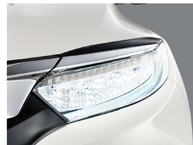
Faróis FULL LED.