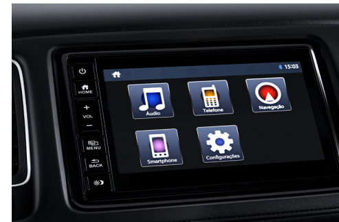
Central Multimídia de 7" multi-touchscreen com navegador e interface para smartphone

Para agregar extrema comodidade a bordo, o modelo possui freio de estacionamento eletrônico acionado ao toque simples de apenas um botão, e função Brake Hold , que mantém o veículo totalmente parado, oferecendo grande praticidade em situações de trânsito.