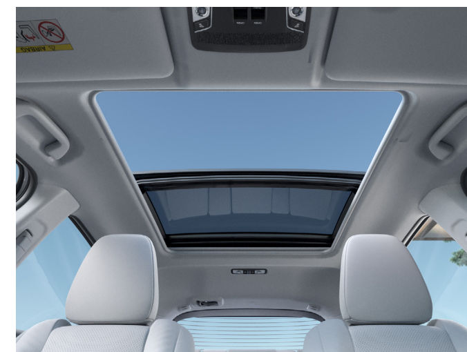
Teto Solar Panorâmico.