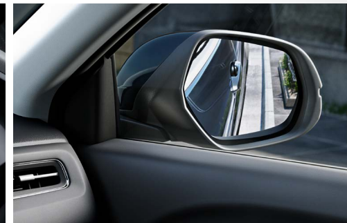
Retrovisores com rebatimento elétrico e função tilt-down

O moderno ambiente interno complementa-se com o ar-condicionado digital full touchsreen , o volante multifuncional com comandos de fácil acesso, vidros elétricos com subida automática; além de tecnologias para redução de ruídos que proporcionam melhor isolamento acústico na cabine.