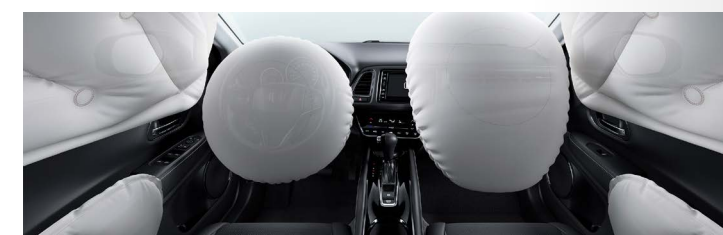
6 airbags (frontais, laterais e de cortina)

Seu conjunto de suspensões e calibrações dos amortecedores garantem uma alta absorção de impactos para viagens ainda mais confortáveis sobre qualquer terreno. O equilíbrio ideal para você desfrutar ao máximo seu prazer de dirigir a bordo do Honda HR-V .