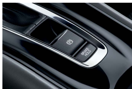
Freio de Estacionamento Eletrônico com função Brake Hold.