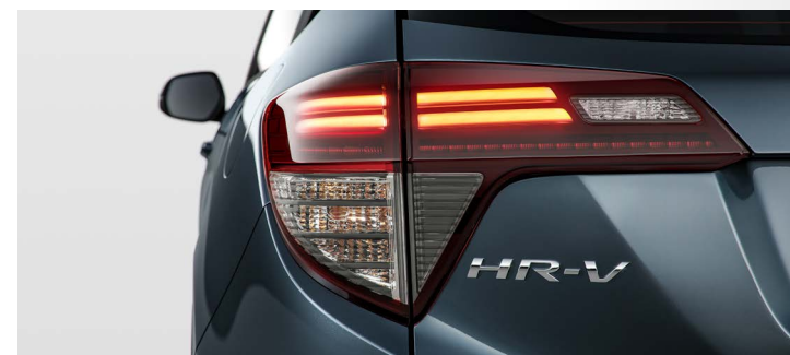
Lanternas traseiras em LED

As novas lanternas traseiras em LED com máscara escurificada e as maçanetas Invisible Handle das portas traseiras, discretamente embutidas na coluna, incorporam-se às linhas aerodinâmicas e vincos marcantes do modelo para reforçar ainda mais sua sofisticação.