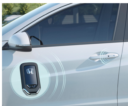
Sistema Smart Entry.

Navegação amigável e intuitiva: o multimídia de 7" multi-touchscreen com interfaces para smartphones Apple CarPlay e Android Auto™ integra funções do navegador GPS , áudio , câmera de marcha a ré e controles integrados ao volante . Mais segurança para você se manter conectado a seus aplicativos preferidos de mapas e músicas, fazer chamadas e enviar mensagens através dos comandos de voz do sistema Bluetooth .