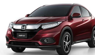
Vermelho Mercúrio Perolizado