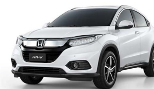
Branco Tafetá Sólido