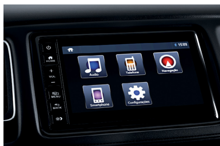
Multimídia 7" com interfaces para smartphones.

Mais tecnologias que garantem uma experiência única para você.