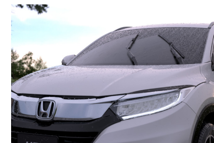
Sensor de chuva.