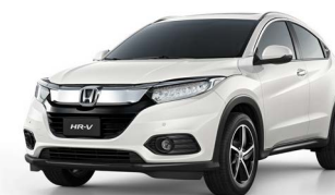
Branco Estelar Perolizado