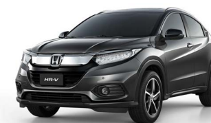
Cinza Barium Metálico