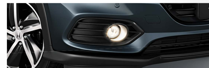
Farol de neblina