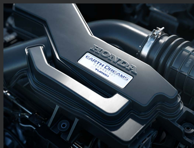
Motor 1.5L Turbo com 173cv e excelente eficiência energética.

Seja na cidade ou em viagens nos fins de semana, o HR-V Touring é perfeito para acompanhar o seu dia a dia.