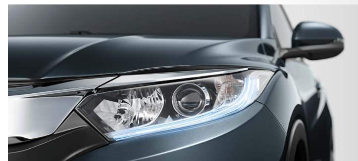
Novos faróis com luzes de rodagem diurna em LED

O Honda HR-V possui um design único, que ressalta o espírito contemporâneo e urbano do modelo que revolucionou a categoria de SUV. Renovado, sua nova grade frontal cromada integrada aos novos faróis com luzes de rodagem diurna em LED e as linhas robustas do seu parachoque destacam toda a sua imponência por onde passa.