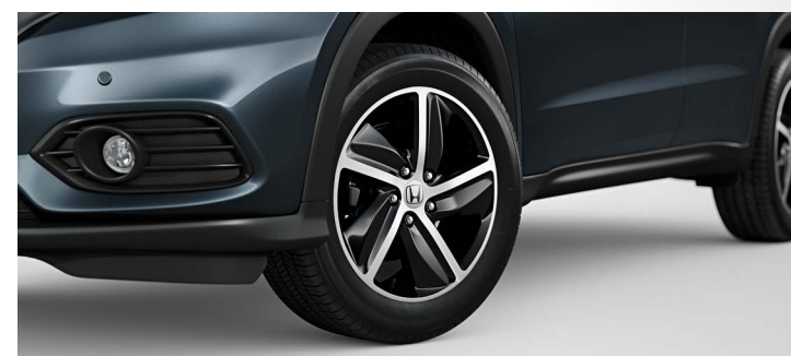
Rodas de liga leve de 17"

O novo design das rodas de liga leve de 17" escurificadas e com acabamento diamantado dão um toque de esportividade ao estilo consagrado do Honda HR-V .