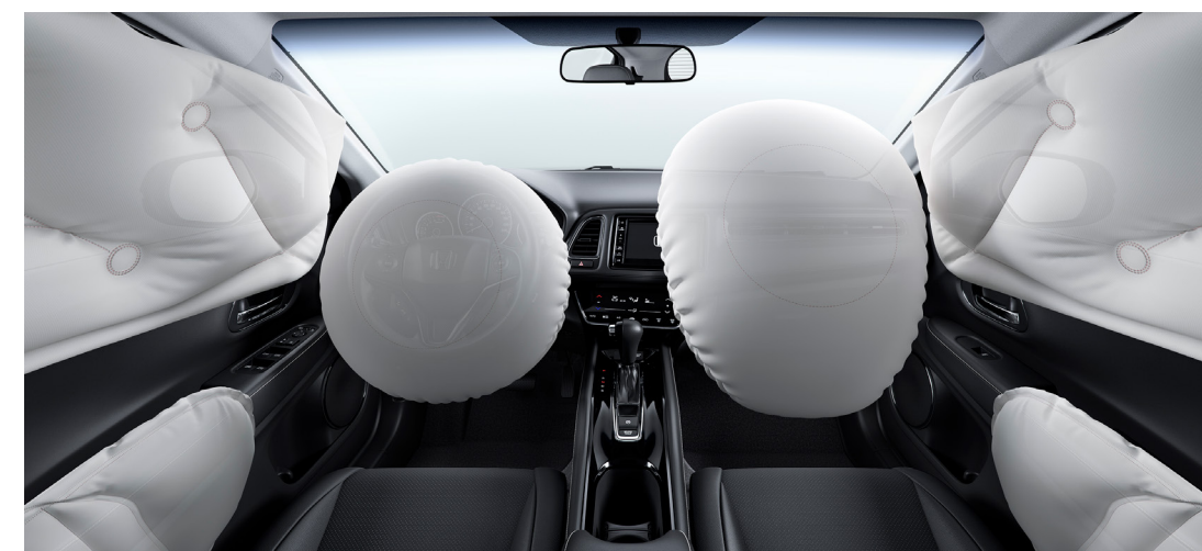
6 airbags (frontais, laterais e de cortina).

Para garantir um trânsito mais seguro, o HR-V Touring vem equipado com novas tecnologias inteligentes. Como o Assistente de Dirigibilidade Ágil (AHA) , que combinado com o sistema de tração e estabilidade VSA , garantem respostas mais precisas e equilibram automaticamente a tração e frenagem das rodas de forma independente para a correção de possíveis desvios da condução do veículo, assim, proporcionando viagens mais tranquilas.