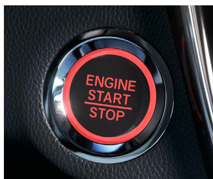
Botão de partida Start/Stop.

Inovação e tecnologia nos detalhes reforçam a experiência única que é dirigir o Honda HR-V Touring . Com um simples toque, você aciona o botão do moderno freio de estacionamento eletrônico , e a função Brake Hold quando ativada mantém o carro parado até o pedal do acelerador ser acionado, garantindo mais conforto em situações de trânsito.