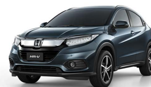
Azul Cósmico Metálico