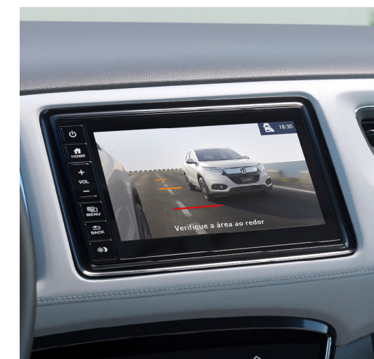
Honda LaneWatch™ - Assistente de redução de pontos cegos.