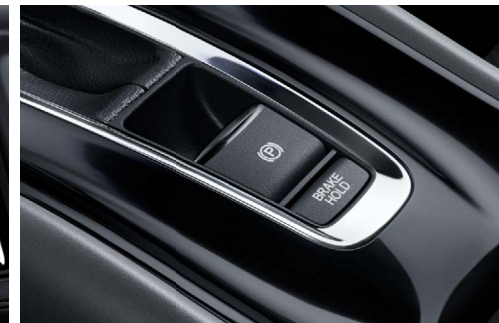
Freio de Estacionamento Eletrônico (EPB) com função Brake Hold