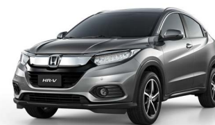
Prata Platinum Metálico